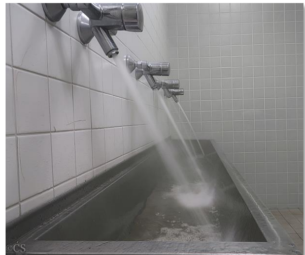
Bild 2: mehrere Entnahmestellen gleichzeitig öffnen

In diesem Fall ist unter Berücksichtigung des geänderten Nutzungsverhaltens weiterhin der bestimmungsgemäße Betrieb zu simulieren.