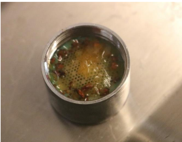
Bild 3: Verunreinigungen verursachen Biofilm

Auch die Peripherie darf nicht vergessen werden. Nach Stillstand und daran anschließender Spülung bzw. Nutzung werden durch sich verändernde Strömungsverhältnisse in den Wasserleitungen Ablagerungen, Schlacken und auch Biofilm gelöst und weitertransportiert. Diese können dann Feinsiebe, Eckventile, Rückflussverhinderer oder Verbrühschutz-Vorrichtungen an Waschbecken und Duschen belegen und verstopfen, was zu Fehlfunktionen und verstärkter Keimbelastung führen kann. Es empfiehlt sich daher, Feinsiebe und Duschschläuche zu entfernen bzw. zu reinigen und eine Funktionsprüfung von Eckventilen, Rückflussverhinderern in Armaturen und Verbrühschutz-Thermostaten durchzuführen.